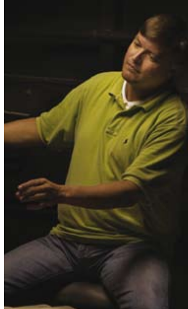
Christian Thielemann

Das Großherzogtum Luxemburg macht immer mehr durch ein dichtes, hochkarätiges kulturelles Angebot auf sich aufmerksam. Erstmals im Herbst 2007 versammelt das Luxembourg Festival herausragende Produktionen in den Bereichen Konzert, Oper, Tanz, Musiktheater und Kunst in einer spartenübergreifenden Zusammenarbeit auf internationalem Niveau. Auf Initiative der Philharmonie und des Grand Théâtre de Luxembourg in Kooperation mit dem Orchestre Philharmonique du Luxembourg (OPL) und den Stater Muséeën bietet Ihnen das Luxembourg Festival über sieben Wochen im Oktober und November 2007 ein Programm mit zahlreichen Highlights und außergewöhnlichen Produktionen. Die feierliche Eröffnung mit Emmanuel Krivine und seinem OPL wird gefolgt von Wolfgang A. Mozarts Oper Le Nozze di Figaro mit Concerto Köln (in Koproduktion mit dem Festival Aix-en-Provence). Es folgen ein konzertantes Gastspiel der Wiener Staatsoper mit Mozarts Don Giovanni , ein außerordentliches Konzert der Bayreuther Festspiele mit einem Querschnitt aus Wagners Ring des Nibelungen unter der Leitung von Christian Thielemann, die neue Premiere des Nederlands Dans Theater, Grigory Sokolov, Michael Nyman, Caetano Veloso, Dianne Reeves, Culture Musical Club, Anne Teresa de Keersmaecker, die Aufführung eines neuen Werks von Heiner Goebbels und eine Vielzahl weiterer erlesener Opern-, Ballett-, Theater- und Konzertabende.