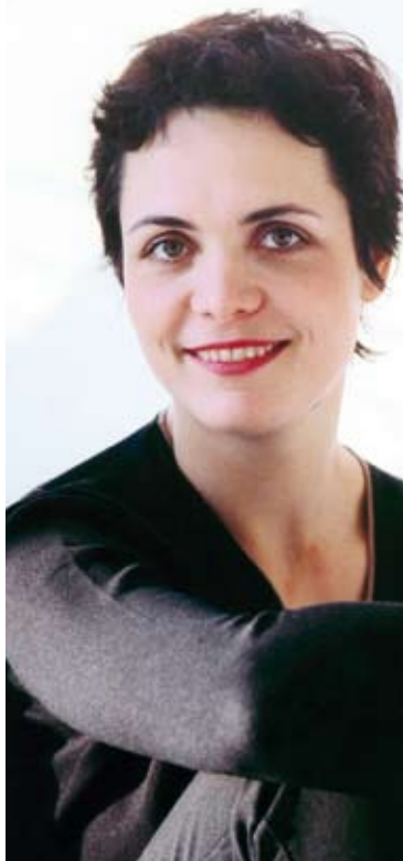
Tabea Zimmermann