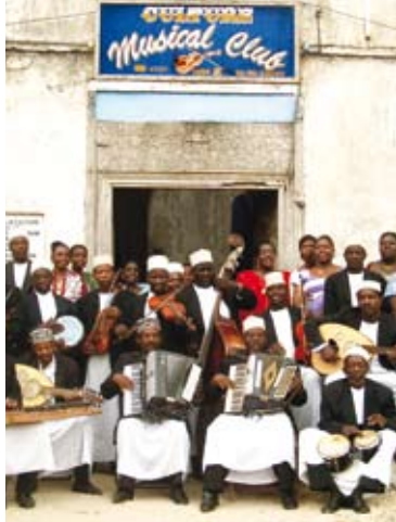
Culture Musical Club: The Big Taarab Orchestra from Zanzibar

Mercredi / Mittwoch / Wednesday 24.10.2007 20:00 • Orchestra