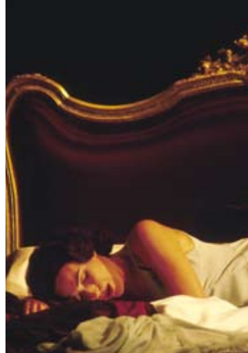
«Le Nozze di Figaro»

Tickets: 25 / 40 / 55 € (tarif réduit <27 ans: 12,50 / 20 / 27,50 €) – ☎(+352) 26 32 26 32