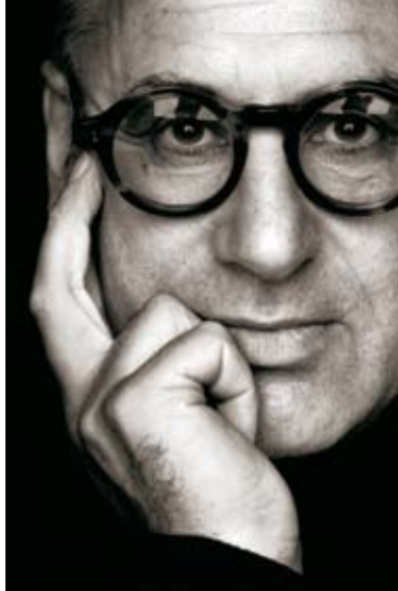
Michael Nyman