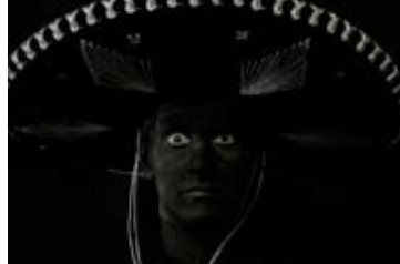
Philippe Decouflé Sombrero

Tickets: 15 / 20 / 25 € (tarif réduit <26 ans: 8 €) – ☎(+352) 47 08 95-1