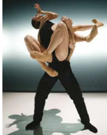
Nederlands Dans Theater © Sharon Mor'Yosef

Tickets: 20 € (tarif réduit <26 ans: 8 €) – ☎(+352) 47 08 95-1