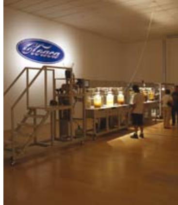
Wim Delvoye: Cloaca New & Improved , 2001

Der Barbarenschatz: Geraubt und im Rhein versunken Le trésor des barbares: Volé et submergé dans le Rhin The Treasure of the Barbarians: Stolen and Submerged in the Rhine