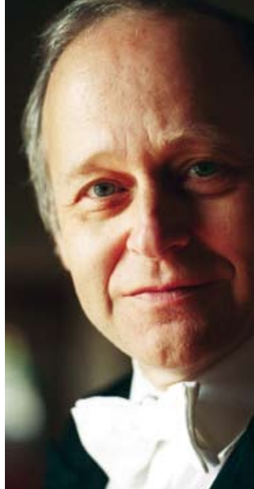
Adam Fischer

Jeudi / Donnerstag / Thursday 15.11.2007 20:00 • Orchestra